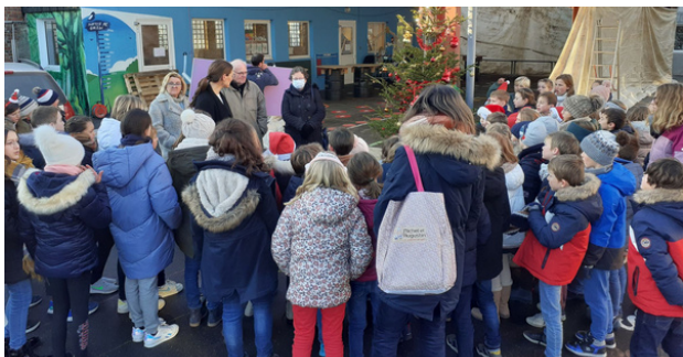
Les bénévoles des Restos du cœur

Cette opération a permis, en cette période de fêtes, d'échanger avec nos élèves sur l'entraide, le plaisir de donner, le partage. Un bel élan de générosité !